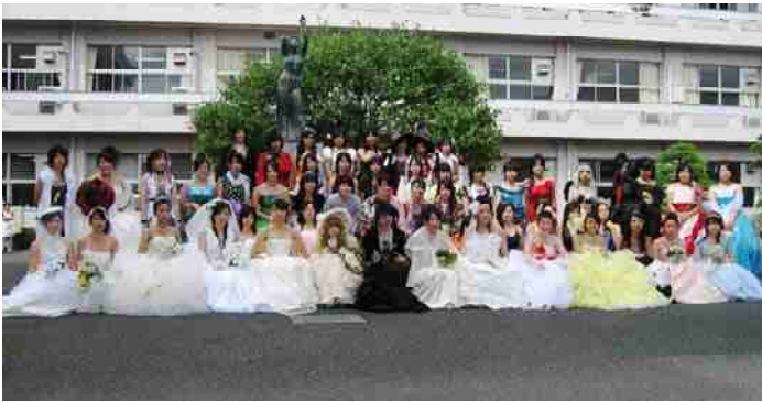
家政科 ファッションショー

【就職】市役所・県警察・郵便局・消防署・日本郵政(株)・日立製作所・東京電力(株)・茨城セキスイハイム(株) 他