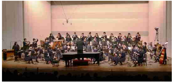
平成20年度音楽科定期演奏会