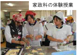
家政科の体験授業