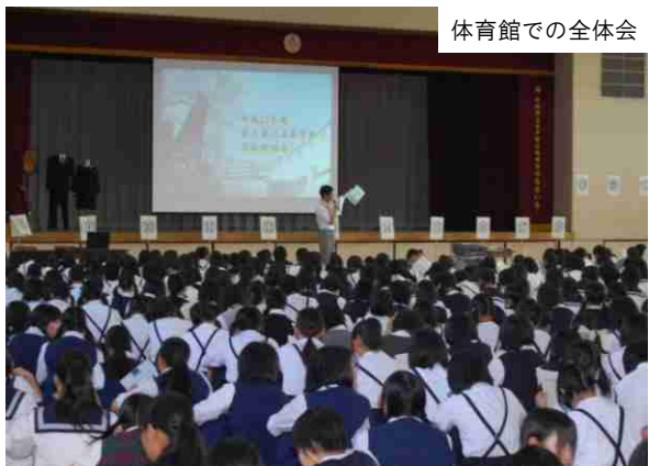
体育館での全体会

全体会の後、普通科と家政科志望者は部活動紹介と家政科の説明、家政科希望者には中高連携事業の体験授業が行われ、音楽科志望者は、授業体験や在校生の演奏を聴き、