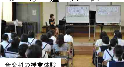
音楽科の授業体験

なお、今年度は、別日程で部活動見学も行われ、約60名の中学生が参加してくれました。