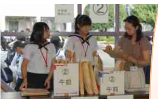
中学生に三高の良さが伝わると良いな